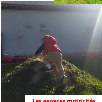
Les espaces motricités