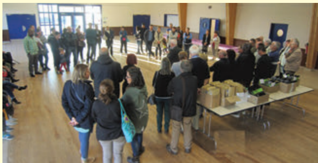
La cérémonie d'accueil du 15 septembre 2017