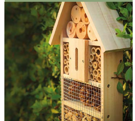
Exemple d'hôtel à insectes

Nous allons installer des bacs à herbes aromatiques et des hôtels à insectes dans notre commune pour apporter une touche de couleurs et d'écologie à notre commune.